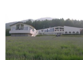
ハイランドふるの