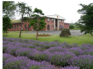
ぶどう果汁工場外観