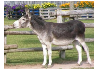
ミニ牧場のかわいいロバ