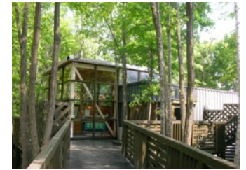
アイスマルク工房