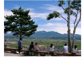
北星山の山頂にて