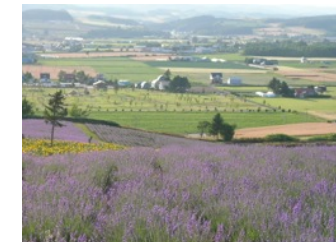
ラベンダー畑と田園風景